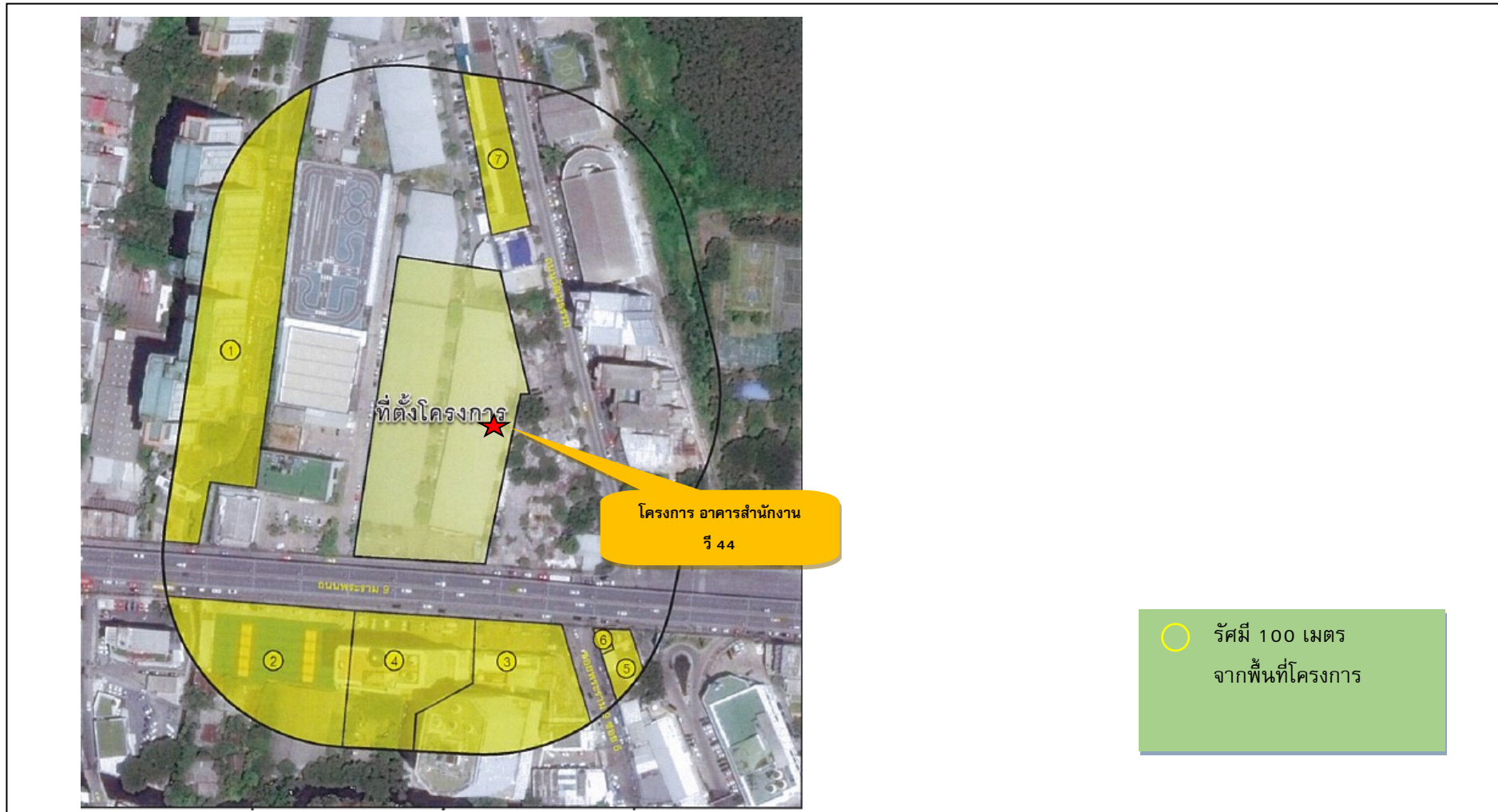
รูปภาพที่ 3 แสดงพิกัดจุดสำรวจข้อมูลสภาพเศรษฐกิจ-สังคมและทัศนคติของประชาชนรายครัวเรือน